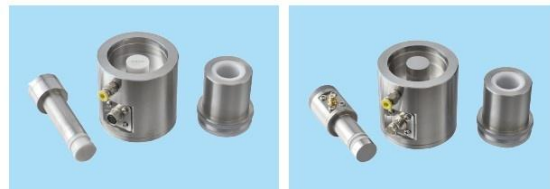
For Low Resistivity (4 pin method)